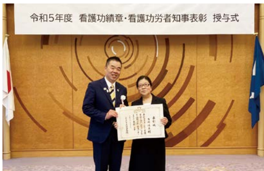
表彰式の様子 三日月知事と多川准教授

この表彰式は、長年にわたり県内において看護業務に従事し、その功労が多大で他の模範として特に推奨すべき方について、知事はその努力と功績をたたえ「看護功労者知事表彰」として表彰するものです。